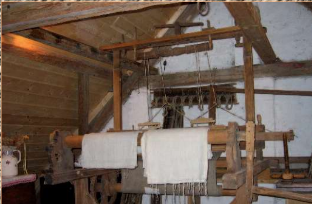
Bauernwebstuhl aus dem Jahr 1856