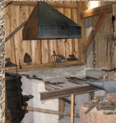
Schmiede aus Lanzenkirchen