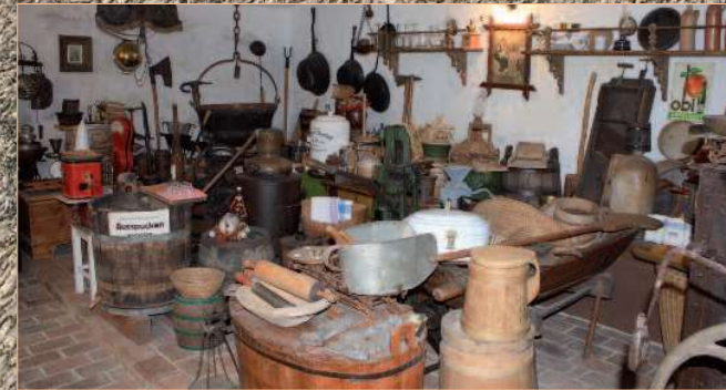
Geschirr aus einer Rauchküche, viele Haushaltsgeräte, Butterfässer, Schnapskessel, Kaffeeröster, Backtrog mit eingeschnitzter Jahreszahl 1731, ...