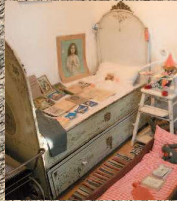
Kinderzimmer mit Wiege, Gitterbett, Spielsachen und Schulbank