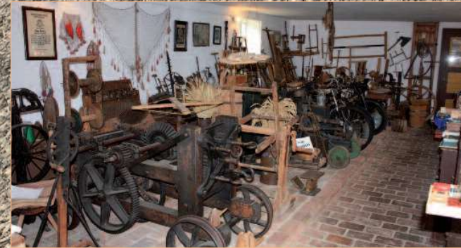
Informiert wird über verschiedene Handwerksberufe (Fassbinder, Tischler, Drechsler, Seiler,...)