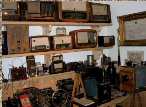
Radios, Fotoapparate, Grammophone, Turmuhr, ...