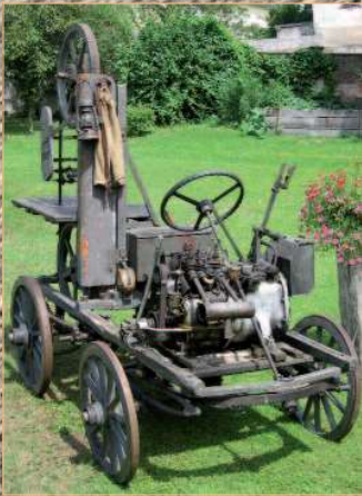
Fahrbare Bandsäge mit Austro Daimler Motor