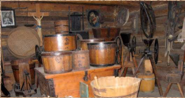
Im über 300 Jahre alten Troackasten (Titelfoto) sind Metzen, Schrotmühlen und andere Geräte zur Getreideverarbeitung untergebracht.